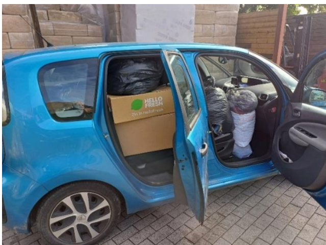
Elke maand een BOM-volle auto. Hierboven de buit van augustus.